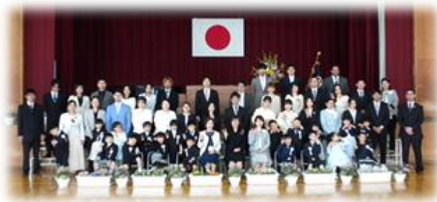
入学記念の写真撮影(新1年生と保護者の皆様・校長・担任)