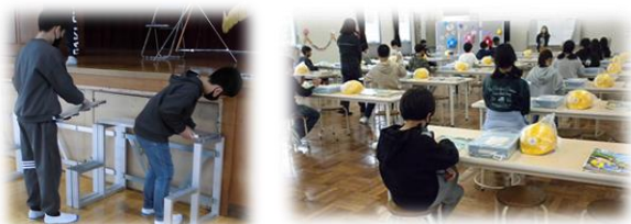
4月3日 6年生会場準備&配付物点検