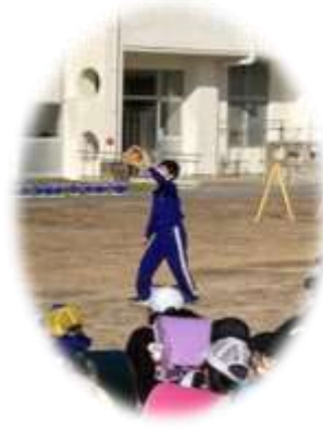
体育委員児童によるキャッチボール