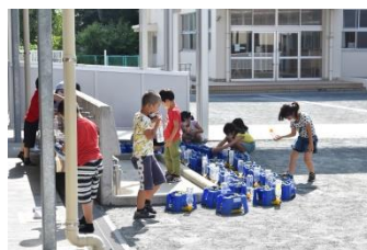
1年生は登校すると、アサガオに水をやります