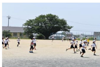
昼休みに運動場で遊ぶ児童