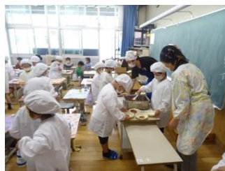
がんばって配膳します

1年生にとっては初めての給食。二ヶ月遅れのスタートです。初日は個包装のあいちの米粉入りパン、牛乳、ハンバーグのケチャップソースかけ、蒲郡みかんゼリーという、配膳しやすいメニューでした。1年生は配膳に慣れていないので、地元の更生保護女性会の方々がボランティアでお手伝いに来てくださいます。いつもは机を向かい合わせにして会食するのですが、今は新型コロナウイルス感染症予防対策で、全員自分の席で前を向いて食べます。それでも「おいしいよ」と嬉しそうに食べていました。