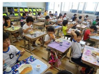
おいしくいただきます