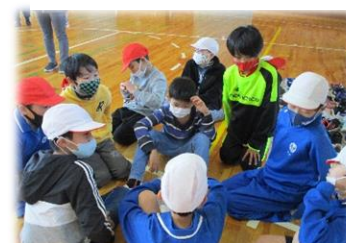
【もうじゅう狩り・トーク】