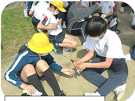
シールに名前を書きます