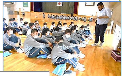
活動場所ごとの打合せ