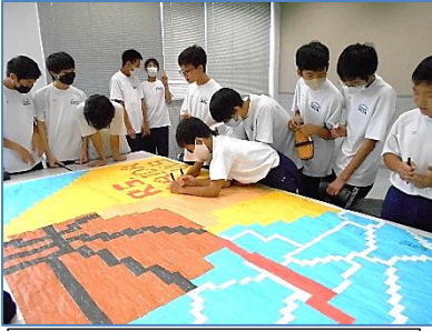
モザイクアート：一人一人メッセージを書きました。

9月5日からは、フェスタ特別日課となり、本格的な準備や練習が始まりました。雨続きで、思うような練習時間がとれませんでした。どのクラスも、少しの晴れ間を利用して、集団跳びや八の字跳び、リレーなどの練習に励んでいました。