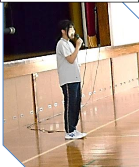
じっこういんちやう 実行委員長の話

9月1日(金)、代中フェスタに向けて生徒集会が開かれました。セレモニー、パフォーマンス、スポーツカーニバル、美術のスタッフと生徒会役員がフェスタを動かします。それぞれのスタッフは夏休み中も学校に集まり、準備を進めてきました。集会では、フェスタの内容や変更点、ステージパフォーマンスの出演者、熱中症対策、フィナーレのダンスなどについて説明がありました。ダンスは、みんなで一度踊ってみました。