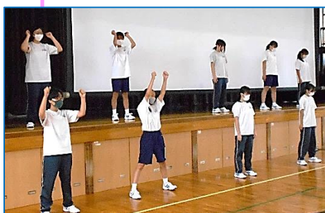
セレモニーで行うダンスの練習