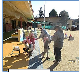
ほいくえん 保育園