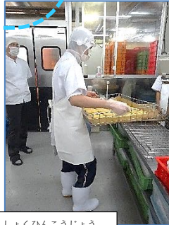
しょくひんこうじょう 食品工場