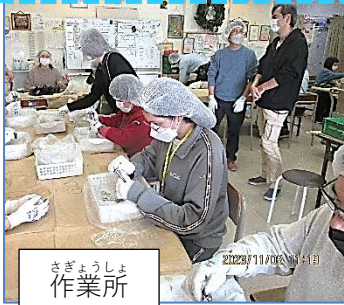
さぎょうしょ 作業所