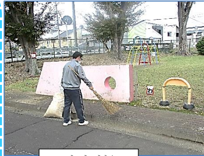
こうつうこうえん 交通公園