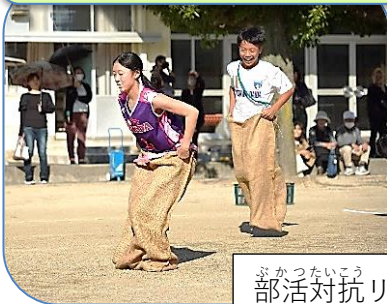
ぶかつたいこう 部活対抗リレー