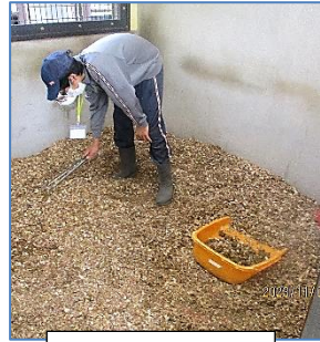
あかつかやまこうえん 赤塚山公園