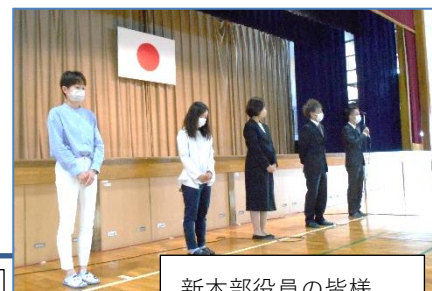
新本部役員の皆様