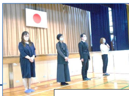
旧本部役員の皆様