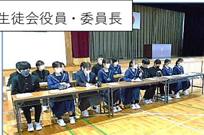
生徒会役員・委員長