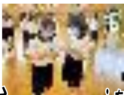
～初めての出会い編～