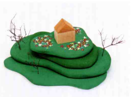
▲回想法アート作品/平松絵美

本展はアウトサイダーアートに加え、認知症予防に効果的とされる「回想法」をアートに取り入れた回想法アート(ライフレビューアート)を使用し、ミュージアムボックス(思い出の箱)の制作を通じて、高齢者とアーティストを結ぶ取り組みを紹介することや、未就学児童の自由な発想を活かしたアート作品などをあわせて展示し、生活や福祉の現場にアートを活かす取り組みを紹介しながら、境界なきアートの世界を紹介します。