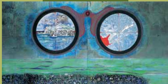
〈北方を望む〉高畑郁子 2000年 / 当館蔵