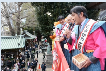
豊川稲荷東京別院節分祭