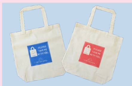
オリジナルエコバッグ