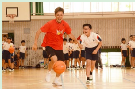
小学生バスケットボール交流会