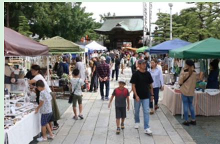
中心市街地活性化イベント

豊川市観光協会と連携し、ホームページやスポット図鑑、四季ごとのお祭りチラシなどにより開催情報を紹介しました。