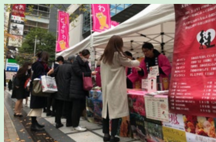
日本橋プロモーションイベント

東京の日本橋で、ひまわり農協、東三温室、観光協会と連携し、豊川産農産物のプロモーションイベントを実施しました。