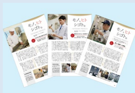
モノ・ヒト・シゴト