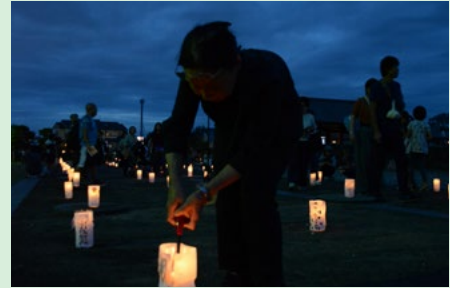
天平ロマンの夕べ

三河国分尼寺跡史跡公園に多くの方が訪れて知っていただくため、「天平ロマンの夕べ」を開催しました。