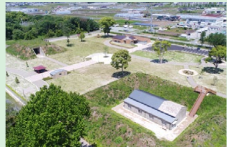
豊川海軍工廠平和公園

滋賀県草津市の「草津宿場まつり」、静岡県磐田市の「見附宿まつり」に出展しPRを行った。