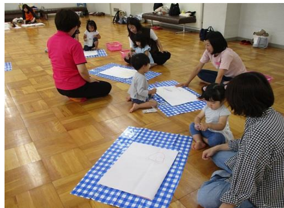
大きな紙に好きな絵を描いてみたよ。