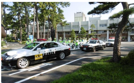
交通安全県民運動出発式

豊川市、豊川警察署、豊川交通安全協会及び豊川防犯協会連合会は、各季の市民運動の期間には、各季の実情に即した運動のテーマを設定し、相互に連携協力して、集中的な啓発活動等を計画し、実施します。その他の団体の中で連携が可能な団体は、相互に協力して運動を進めます。