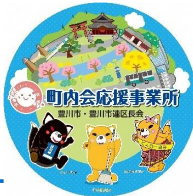
応援事業所ステッカー