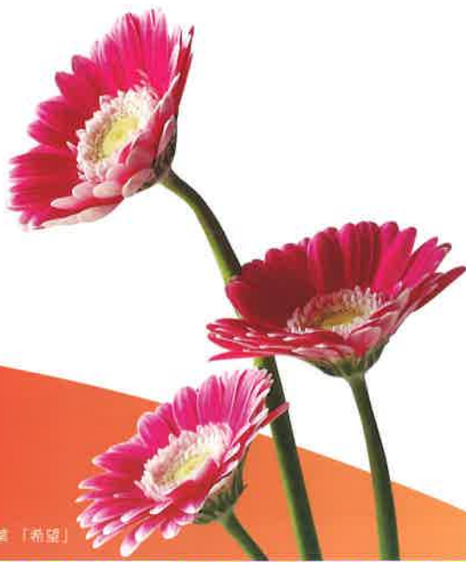
ガーベラの花言葉「希望」

「希望の絆」では就職に必要な技術・訓練・コミュニケーション能力を学び、個々のニーズに合わせた作業及びカリキュラムを実践します。また、企業様との委託契約をさせて頂き、施設外作業を行うことでその経験を活かし一般就職へのサポートを致します。私達スタッフ一同も利用者様と一緒に目標を考え、一步一步の行動を大切に進んでいきます。そうすることで利用者様と社会との架け橋となる「希望の絆」でありたいと思っています。