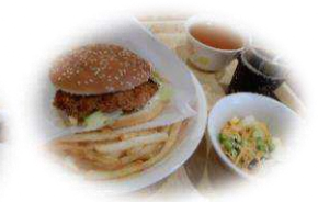
あけぼのバーガー