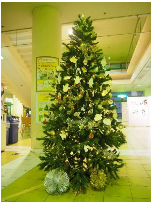
地域包括ケアの実（自分にできること）をたくさんつけた「地域包括ケアの木」