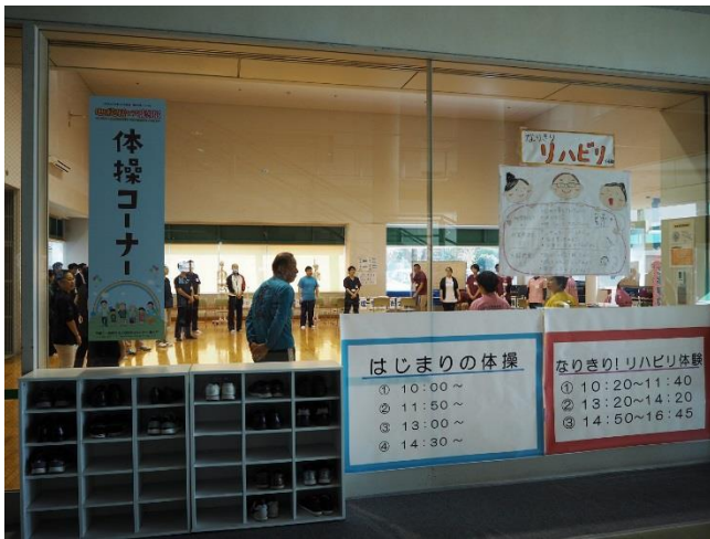
体操コーナーの様子