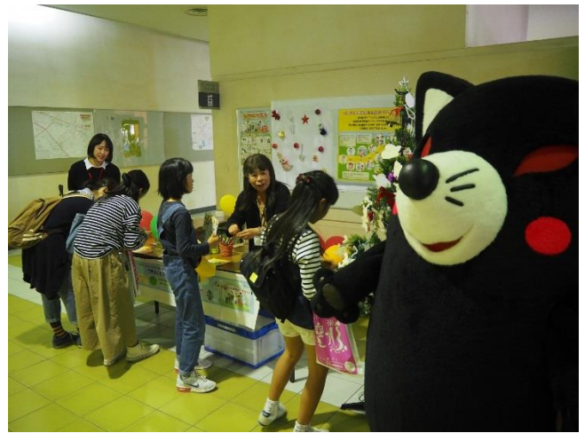
自分にできることを書き出すワークの様子