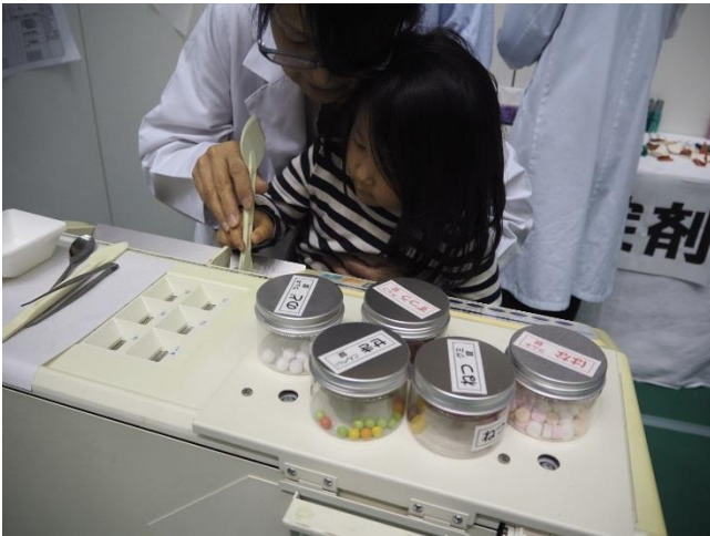
お菓子で調剤体験の様子