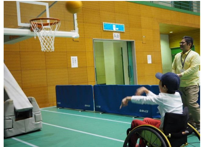
競技用車いす試乗体験の様子