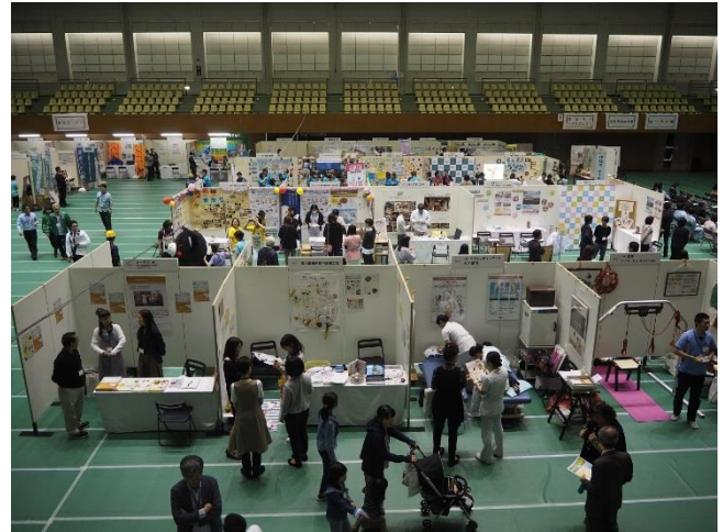
ブース展示の様子