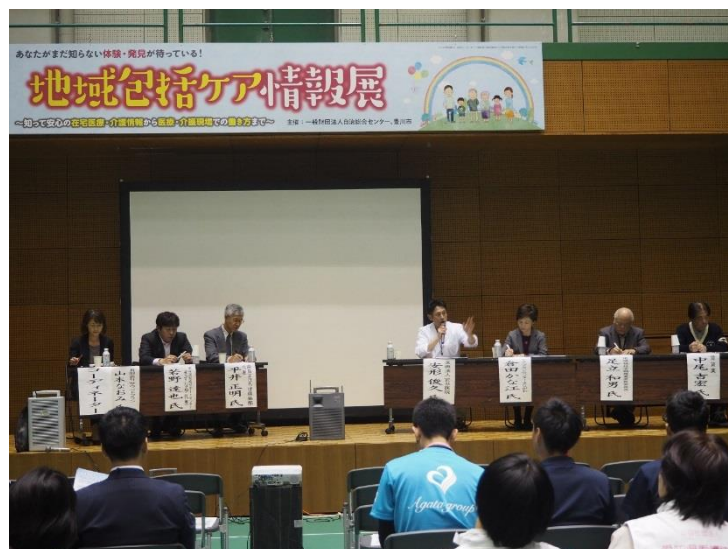
パネルディスカッションの様子