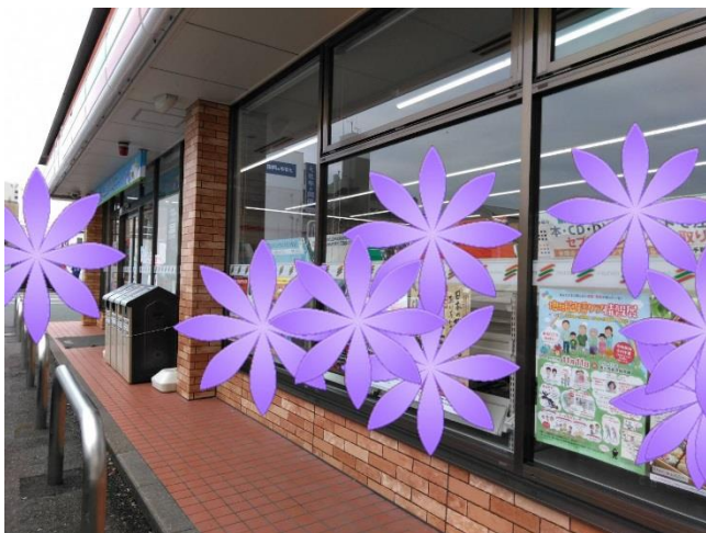
コンビニエンスストアでのポスター掲出の様子