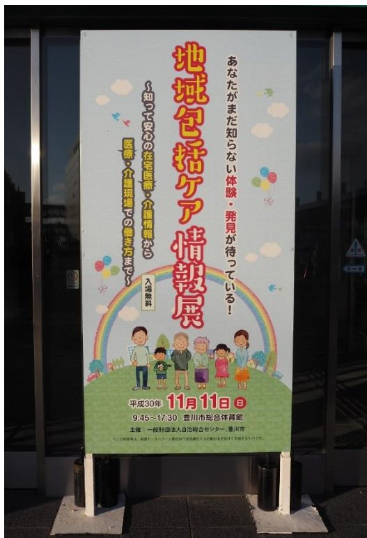
会場入口立て看板

http://www.city.toyokawa.lg.jp/kurashi/fukushikaigo/zaitakuiryo/houkatu/oshirase/zaitaku300926.html