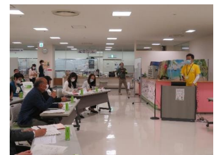
前回の公開プレゼンの様子

※公開審査は、数分程度の申請団体による事業内容の発表（プレゼンテーション）を行います。 ※審査基準につきましては、申し込みの際に各団体へお渡しさせていただきます。