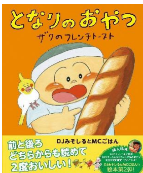
左：コドモラップ、右：絵本「となりのおやつ」

公演当日はアーティストの多彩な魅力が味わえる関連イベントを開催します。詳細は添付チラシ参照。