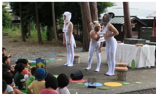
2019年、子ども食堂ひまわりキッチン(諏訪)で開催した出張企画「テーブルシアター」の様子