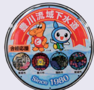
豊川流域下水道推進協議会の デザインマンホール缶マグネット