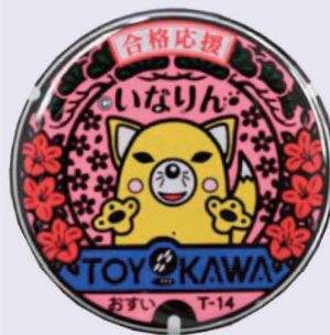
いなりんマンホール 缶マグネット・缶バッジ