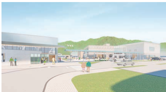
一宮地域交流会館(仮称)イメージ

令和9年度に開館予定の 「一宮地域交流会館(仮称)」 の愛称を募集します。募集 要綱を確認の上、応募して ください。 応募作品 応募者自身の創 作による未発表のもので、 第三者の著作権、商標権な どの知的財産権を侵害しな いもの(1人1点まで) 賞・賞品 優秀賞3作品に 5千円分の図書カードを進 呈 申込 4月15日から5月29 日まで(必着)。申込書を直 接、または郵送で、財産管 理課(北庁舎3階)へ。市