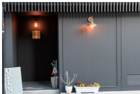
豊川稲荷門前町の一角にある店舗は、黒くてシックな外装と金色のランプが目印