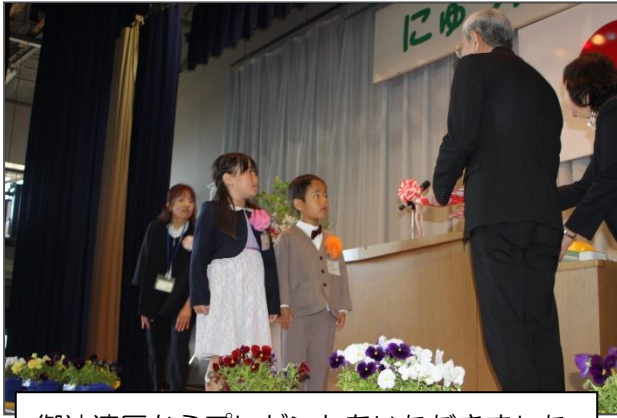
御油連区からプレゼントをいただきました