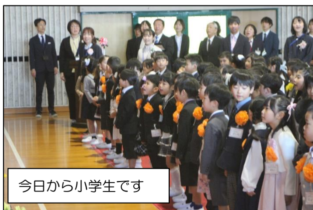
今日から小学生です

地域の皆さん、保護者の皆さん、今年度も一緒に御油っ子たちを伸ばしていきましょう。引き続き、御油小学校をよろしくお願ひします。