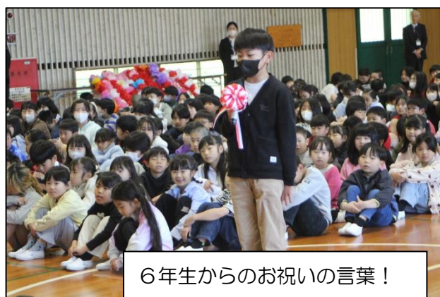
6年生からのお祝いの言葉！