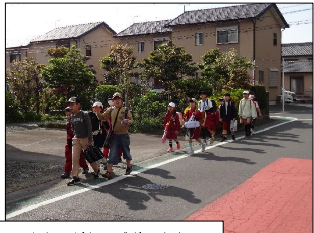
見守りをしてくださっている皆様！ いつもありがとうございます！