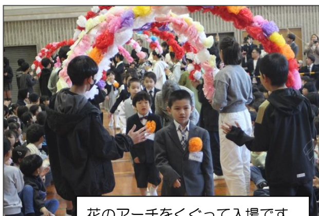
花のアーチをくぐって入場です

学級に戻ってからは、それぞれのクラスで学級開きが行われました。子どもたちは新しい先生と新しいクラスに期待感を膨らませている様子でした。担任の先生たちからも新しい出会いにワクワクしている様子が伝わってきました。