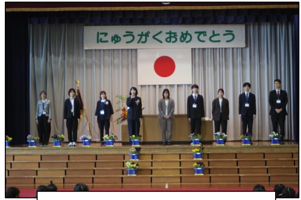
新しく9名の先生が着任しました