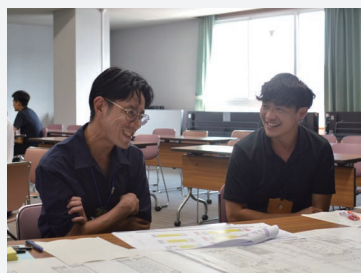
③雰囲気づくりのアイスブレイク