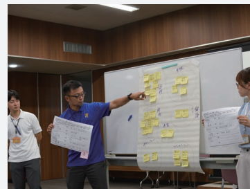
⑥グループで話し合ったことを発表