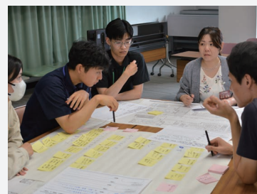
④テーマに沿ってグループでワーク