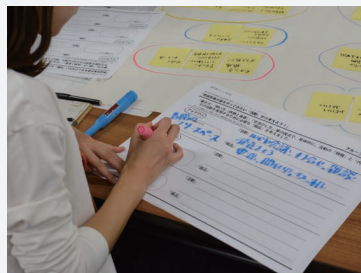
⑤発表に向けてまとめの作業