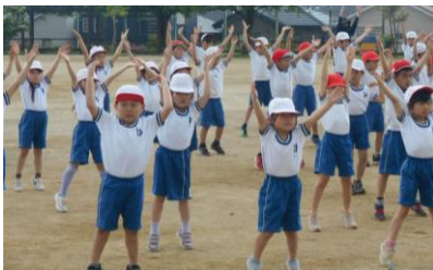
1、2年生 ラジオ体操の練