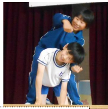
児童会企画ペア遊び「ジェスチャークイズ」