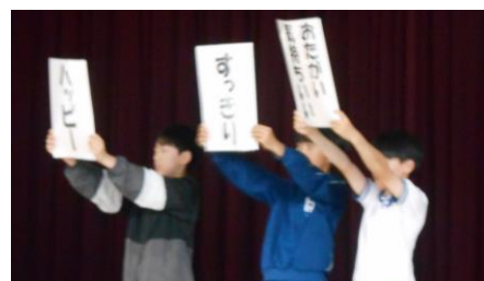
挨拶をすると ハッピー すっきり あたたかい、気持ちよくなります。