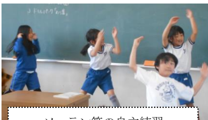
ソーラン節の自主練習