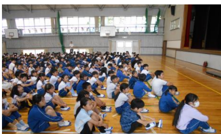
児童会の発表をみんな聞いています。