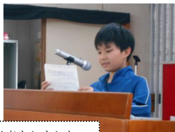
保健委員会の発表「手ピカ週間」について全校生徒に発表をしました。