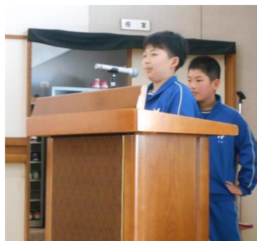
栽培委員会「緑の羽根の募金」について発表