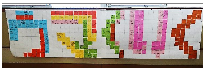
学年掲示板の様子 「馬くいく」