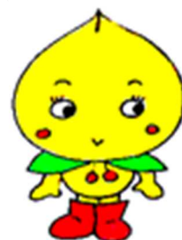
誕生日会のキャラクター 「つぼみ」です