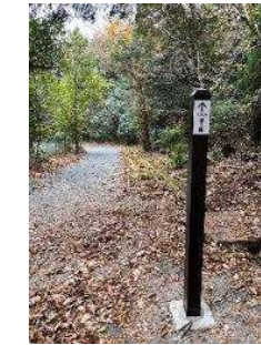
牛の滝遊歩道の再整備