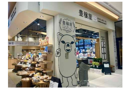
イオンモール内アンテナショップ