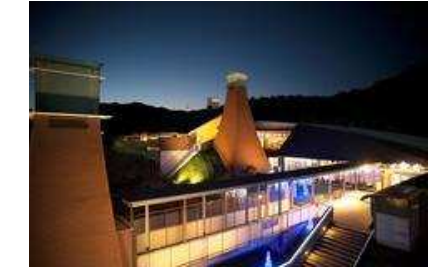
本宮の湯のリニューアル整備