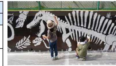
マイストーリーとよかわ