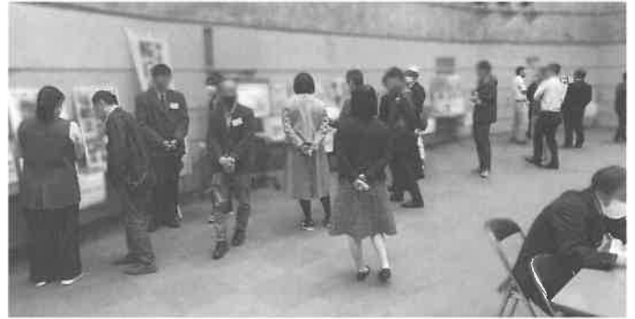
「東三河生態系ネットワークフォーラム2024」の様子（アイプラザ豊橋）