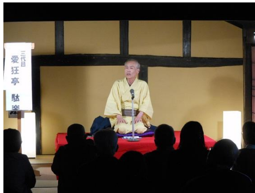
はたご de らくご

実施日 令和7年11月15日（土） 内 容 愛狂亭駄楽・愛狂亭苦楽による 落語を実施。 参加者 33人