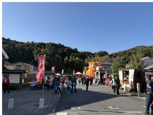
赤坂宿宮路もみじまつり+ 赤坂町歩けあるけ大会

※音羽商工会・赤坂町内会協働事業（令和2年度～） 実施日 令和7年11月30日（日） ウォーキング参加者 498人 （もみじ祭りは約500人）