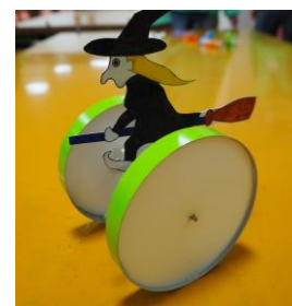
モビリティロボット