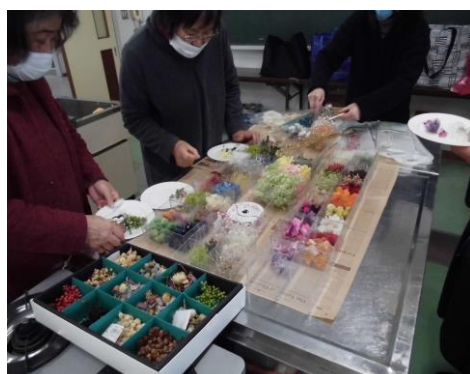
ハーバリウム教室 (フラワーショッパー期一会)