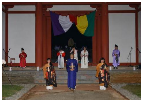
天平ロマンの夕べの様子

三河国分尼寺跡史跡公園は、平成7年度に策定した「史跡三河国分尼寺跡保存整備基本計画」に基づき、平成17年11月に開園しました。併設する三河天平の里資料館では、発掘調査の出土品や映像により古代三河国について解説しているほか、歴史講座や体験教室を行っています。毎年9月下旬にロウソクの明かりで園内を照らすイベント「天平ロマンの夕べ」を開催しており、またボランティアガイドによる来園者への説明ガイドも行っています。