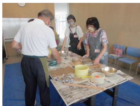
陶芸教室 (尾藤工芸社)