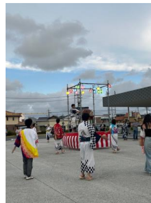
青年団盆踊り大会