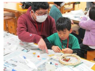
親子ふれあい工房の様子