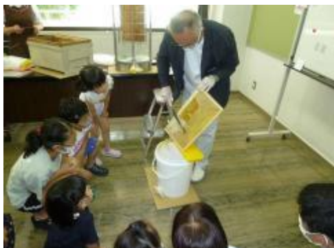
蜜蜂からの贈り物 (有限会社さんぼ道)