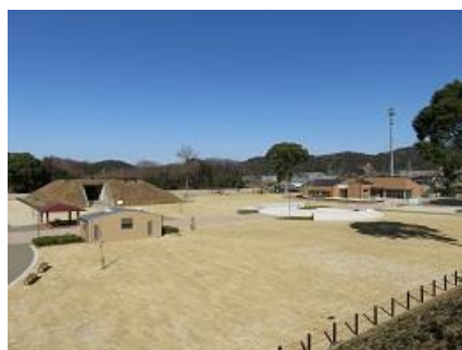
豊川海軍工廠平和公園

豊川海軍工廠平和公園は、平成29年度に残存遺構の保存整備工事及び交流施設の建設を行い、平成30年6月に開園しました。公園内には豊川海軍工廠の歴史や平和について学ぶ平和交流館や、市指定史跡の旧第一火薬庫や旧第三信管置場などの戦争遺跡があり、ボランティアによる来園者への説明ガイドを行っています。また、交流館では歴史講座や体験教室などを開催しています。