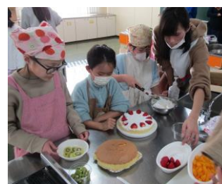
クリスマス会の様子