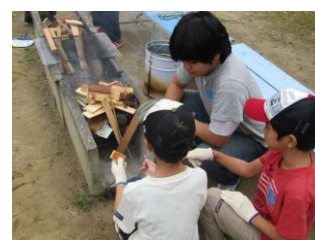
デイキャンプの様子

活動は毎月1回の定例会、デイキャンプ、クリスマス会等の実施、他市ジュニアリーダーとの交流、県子連主催等の研修参加、KYT研修会でのレクリエーション実施など行っています。