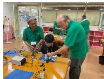
子どもものづくり教室の様子