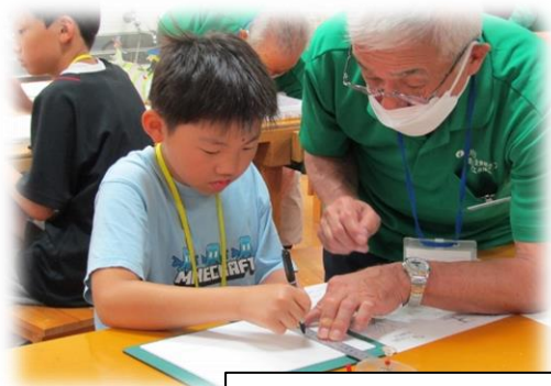
子どもものづくり教室