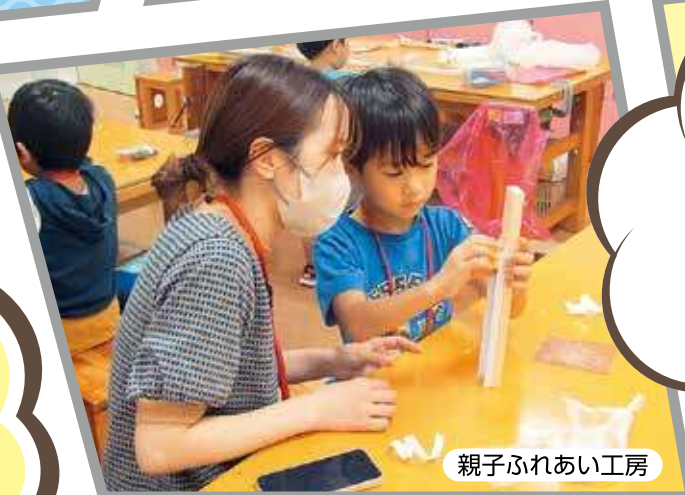
親子ふれあい工房