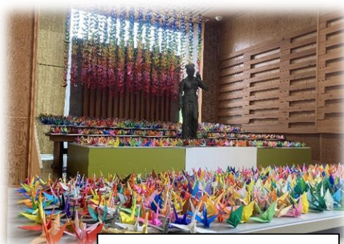
折り鶴に平和の祈りを