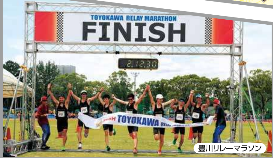
豊川リレーマラソン