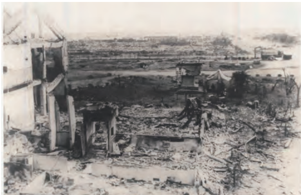
空襲後の豊川海軍工廠