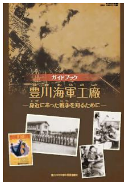
ガイドブック豊川海軍工廠

「ガイドブック豊川海軍工廠」「リーフレット あの日、私の体験」については一般の方へ平和公園等で配布した。