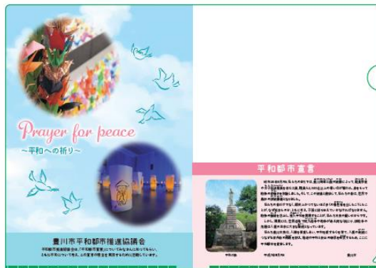
クリアファイル及びYouTube の案内