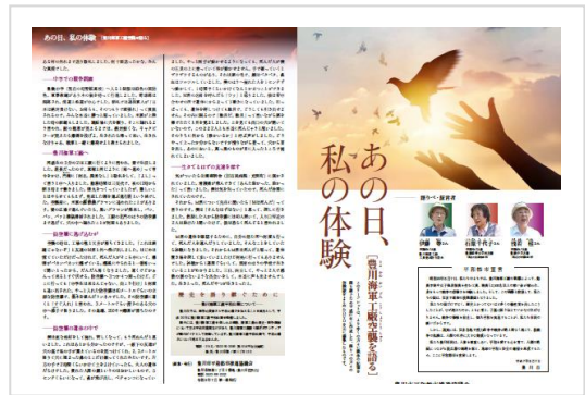
リーフレット あの日、私の体験