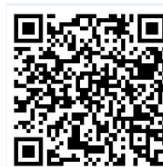
市 HP 「返礼品を募集」