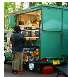
キッチンカーでの 食事販売の状況