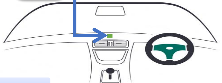
車両のダッシュボード