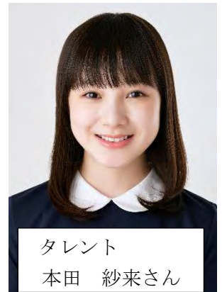
タレント 本田 紗来さん