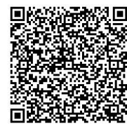
ボランティア申込ページ

※任意の様式に①氏名、②生年月日、③住所、④電話番号、⑤緊急連絡先（氏名・電話番号）を記入し、実行委員会事務局（スポーツ課内）へお申し込みください。