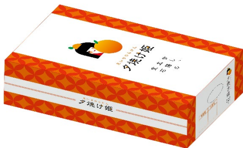
化粧箱の完成デザイン