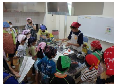
平成28年度 料理体験の様子