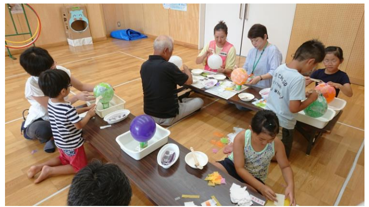
あかさか児童館にて地域の子どもたちが手作りしました。