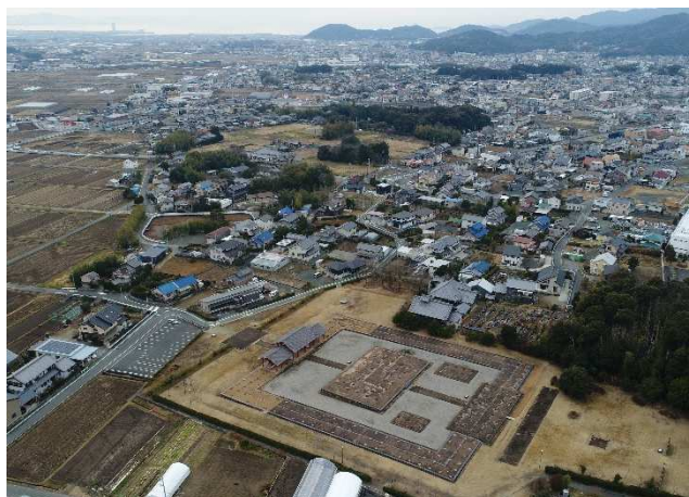
古代三河国分寺（奥）・国分尼寺（手前）の想像図と現在の様子