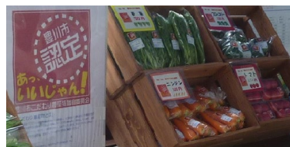
※こだわり農産物のイメージ