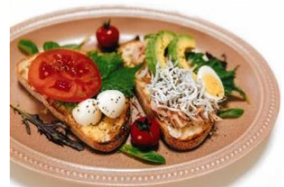
第9回おもてなしレシピグランプリ 最優秀賞 「簡単！美味しい！映える！ 豊川モーニングフランス」

※豊川市農政企画協議会とは、豊川市、愛知県、ひまわり農業協同組合、東三温室園芸農業協同組合の関係者で構成し、農業振興のための様々な事業の計画立案、実施を行っている組織です。