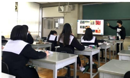
創業について講義を聴く生徒たち

参加した生徒からは「今まで創業に触れる機会がなく興味もなかったが、自分のやりたいことを仕事にするのは良いと思った」、「創業は簡単ではないけれど、高校生起業家もいて、身近なことだと感じた」との声が聞かれ、教室に参加した前と後で創業への関心に変化が見られました。