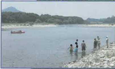
いつまでもきれいな水辺