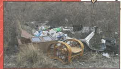
ますますゴミが増える