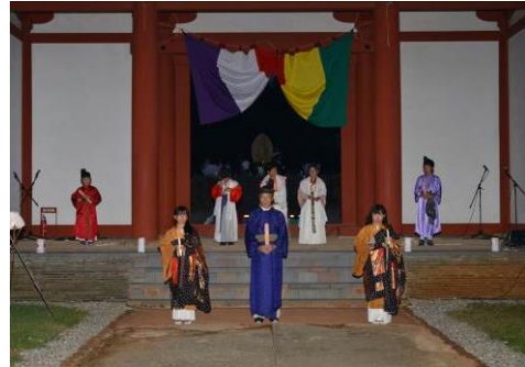
天平ロマンの夕べの様子

三河国分尼寺跡史跡公園は、平成7年度に策定した「史跡三河国分尼寺跡保存整備基本計画」に基づき、平成17年11月に開園しました。併設する三河天平の里資料館では、発掘調査の出土品や映像により古代三河国について解説しているほか、歴史講座や体験教室を行っています。毎年9月下旬にロウソクの明かりで園内を照らすイベント「天平ロマンの夕べ」を開催しており、またボランティアガイドによる来園者への説明ガイドも行っています。