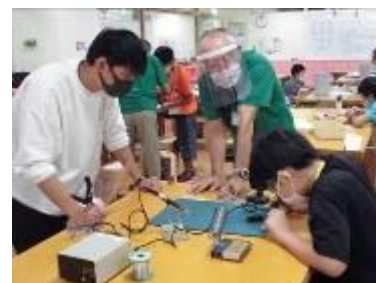
子どもものづくり教室の様子