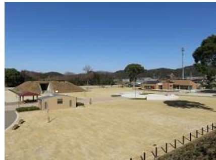
豊川海軍工廠平和公園

豊川海軍工廠平和公園は、平成29年度に残存遺構の保存整備工事及び交流施設の建設を行い、平成30年6月に開園しました。公園内には豊川海軍工廠の歴史や平和について学ぶ平和交流館や、市指定史跡の旧第一火薬庫や旧第三信管置場などの戦争遺跡があり、ボランティアによる来園者への説明ガイドを行っています。また、交流館では歴史講座や体験教室などを開催しています。