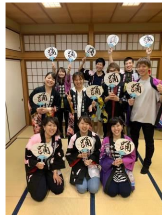
青年団盆踊り大会