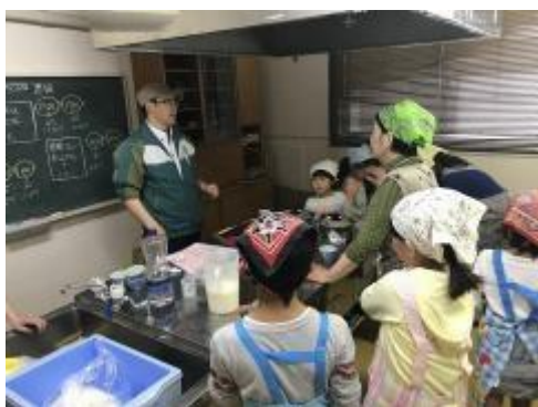
豆腐づくり体験 (株式会社 寺部食品)