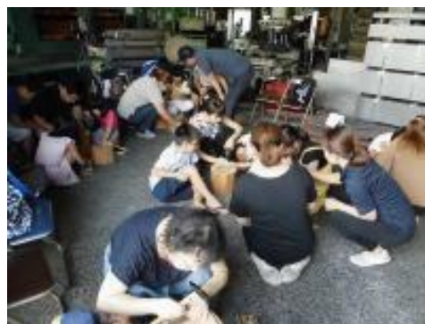
スプーン作り体験 (株式会社 加藤数物)