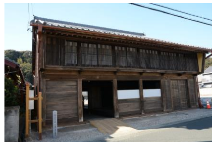
大橋屋（旧旅籠鯉屋）

大橋屋（旧旅籠鯉屋）は、平成29～30年度に建物の保存整備工事及び周辺整備を行い、平成31年4月に開館しました。ボランティアによる説明ガイドや、体験講座などを開催しています。