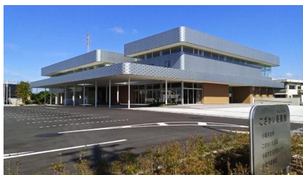
こぞかい葵風館 (令和 3 年 5 月 2 日オープン)