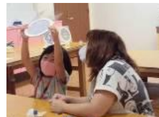
親子ふれあい工房の様子