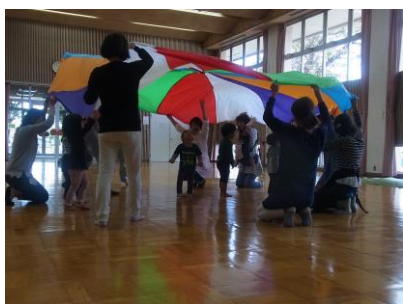
講座「ふれあい体験」