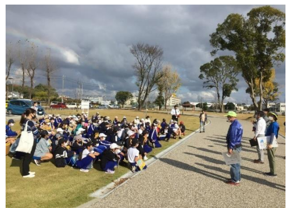
市内小学6年生児童見学事業風景