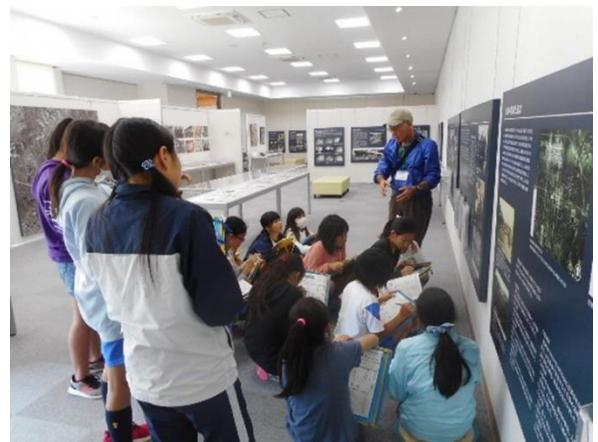
平和交流館内のガイド風景