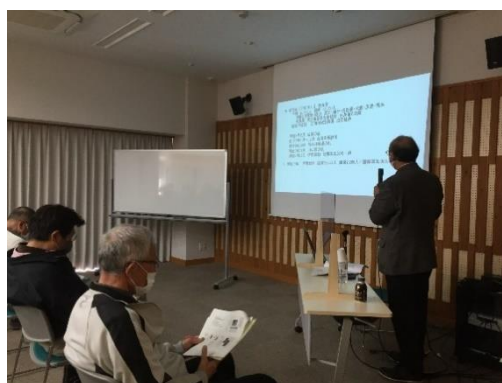
「豊橋市に残る戦争遺跡について」