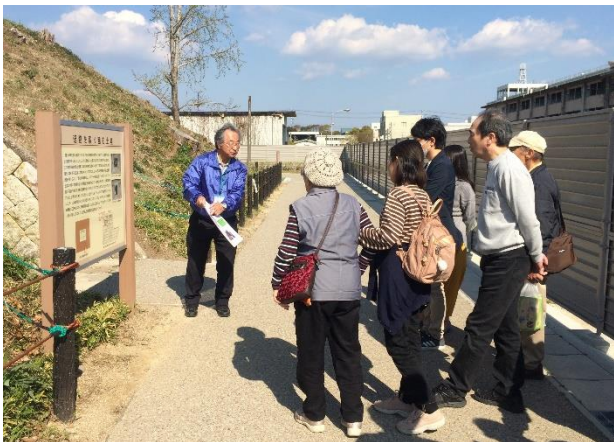
園内のガイド風景

*新型コロナウイルス感染拡大に伴う緊急事態宣言発令により、4/12～5/24まで平和交流館を閉館。