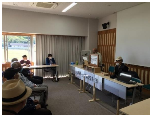
渥美線電車機銃掃射の体験談を聴く会