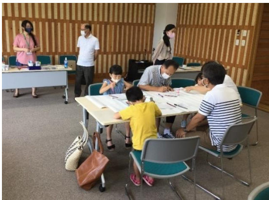
平和のミニ行灯づくり