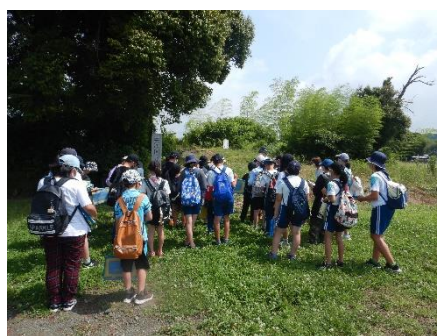
三河国分寺跡見学の様子