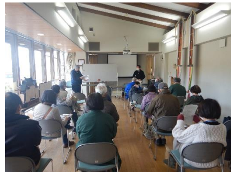
ボランティアガイド定例会の様子

令和4年4月定例会：2日（土） 令和4年5月定例会：7日（土） 令和4年7月定例会：2日（土） 令和4年8月定例会：6日（土） ※書面開催 令和4年9月定例会：3日（土） 令和4年11月定例会：5日（土） 令和5年1月定例会：7日（土） 令和5年3月定例会：4日（土）