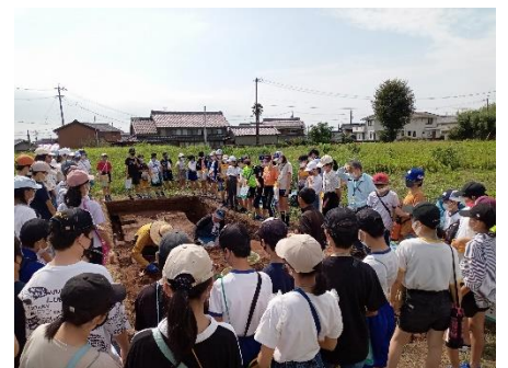
発掘調査現場見学の様子