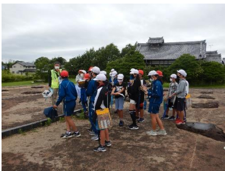
三河国分尼寺跡史跡公園見学の様子

また、10月以降の実施校は見学事業実施期間と三河国分寺跡確認調査の期間が重なったため、国分寺跡では文化財係職員対応のもと、発掘調査現場の見学を併せて実施した。