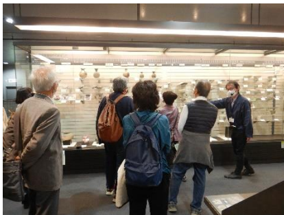
瀬戸蔵ミュージアム