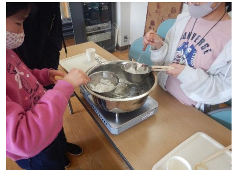
アロマキャンドル作り